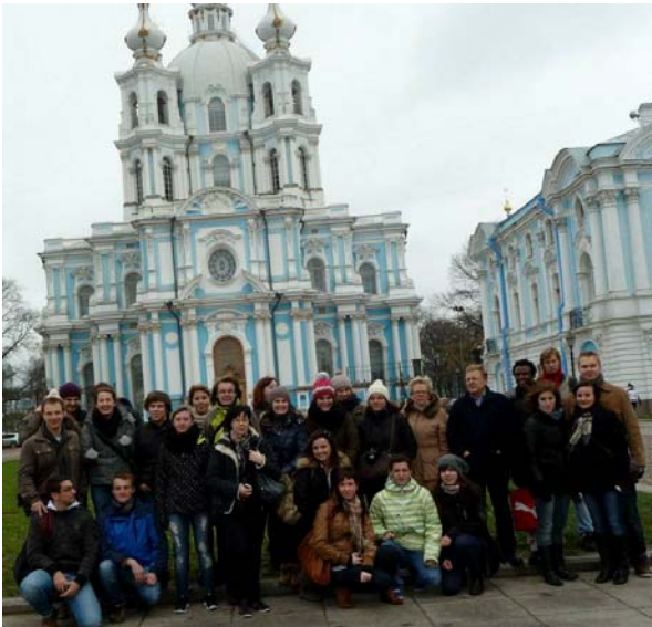
Gruppenfoto, St. Petersburg

Die Abende wurden oftmals gemeinsam verbracht. Mehrmals haben wir diese mit Kochen begonnen, so dass es „italienische, deutsche oder asiatische Abende“ gab, an denen es typisches Essen aus den entsprechenden Ländern gab, um auch die kulinarische Vielfalt der Kommilitonen kennenzulernen. Anschließend sind wir zusammen feiern gegangen. Außerdem hat KAMO (dortige Studentenunion) mehrere Ausflüge veranstaltet, unter anderem zum Weihnachtsmandorf in Rovaniemi oder ein Wandertrip mit anschließender Übernachtung in einem Ferienhaus im Wald direkt am See (in Ruka).