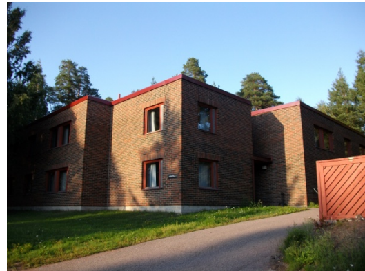
Abbildung 2: Studentenwohnheim

Während des Auslandssemesters wohnte ich in dem Studentenwohnheim der Fachhochschule. Dort stand jedem Student ein eigener Raum inklusive Bad zur Verfügung. Auf jedem Stockwerk war eine Gemeinschaftsküche, die nicht nur zum Kochen sondern auch als Aufenthaltsraum benutzt wurde. Die Bereitstellung von Handtüchern, Bettwäsche sowie die Nutzung der Waschmaschine waren in dem Mietpreis inbegriffen. Als Highlight des Studentenwohnheims galt die Sauna, die man jeden Dienstag, Donnerstag und Sonntag nutzen konnte.