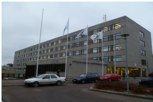
Abbildung 3: Fachhochschule Kymenlaakson

Die Busverbindung zwischen Studentenwohnheim und Fachhochschule ist gut. Die Fachhochschule ist nicht nur mit dem Bus sondern auch zu Fuß sowie mit dem Fahrrad sehr gut erreichbar.